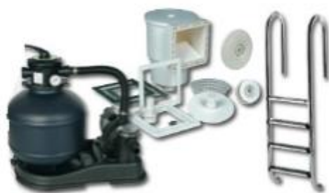
Technikset bis 30 m 3